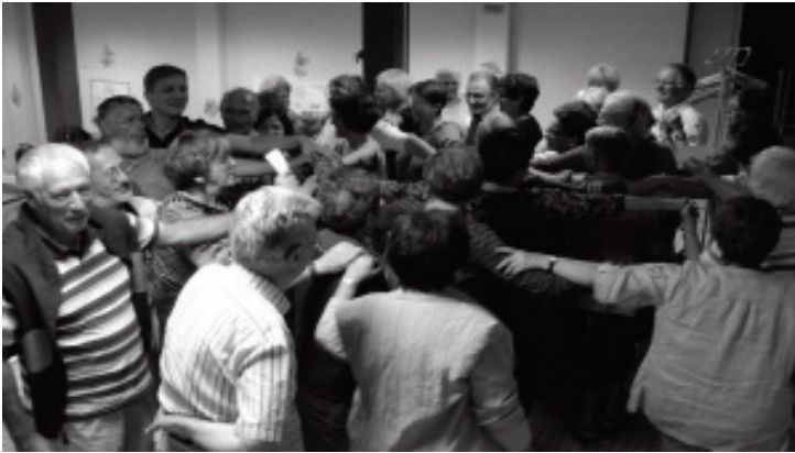
Solidaires pour construire un monde nouveau. Soirée commune aux deux sessions

Personne ne s'aventure dans le désert sans nourriture. Dans le récit de la multiplication des pains (Jn6), le signe qui est proposé est le petit garçon qui donne ce qu'il a. Ce qui se réalise ensuite, avec Jésus, c'est le partage de ce que les gens ont et de ce qu'ils sont !